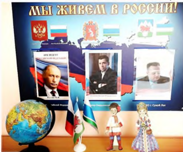
Уголок патриотического воспитания