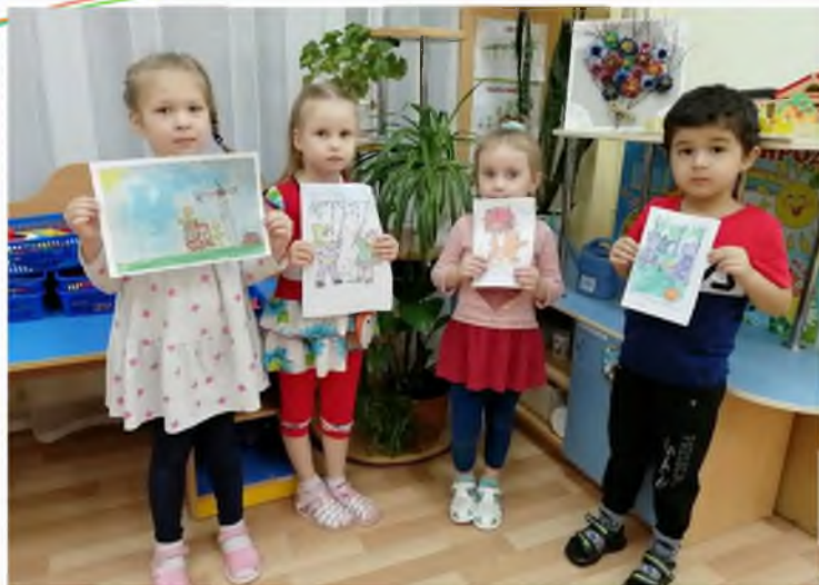
Смотрим и рисуем картинки про безопасность