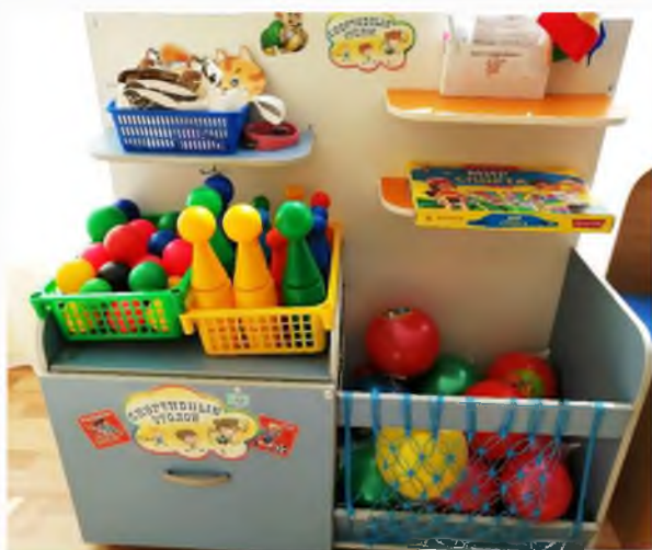
Уголок физического развития