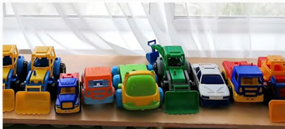
Транспортное «хозяйство» мальчишек