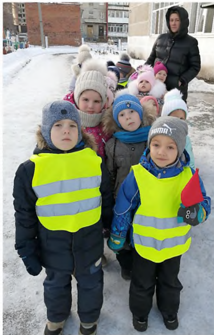
Сейчас мы пешеходы