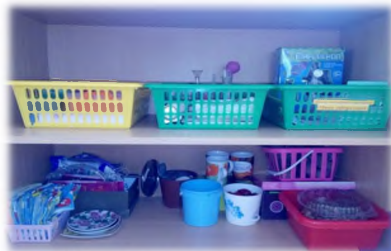
Центр экспериментирования «Мини-лаборатория»