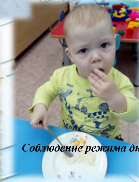
Соблюдение режима дня