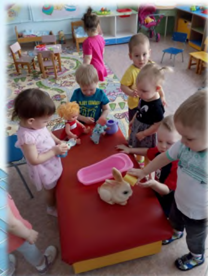
Воспитание и формирование культурно – гигиенических навыков