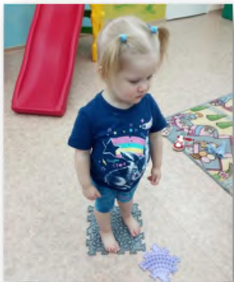
Босохождение по корригедорожкам