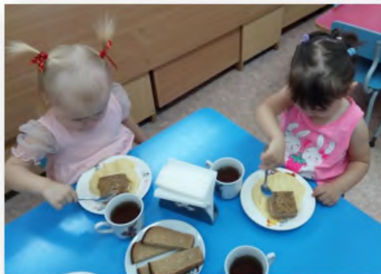
Воспитание и формирование культурно – гигиенических навыков