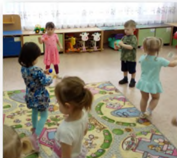
Соблюдение режима дня