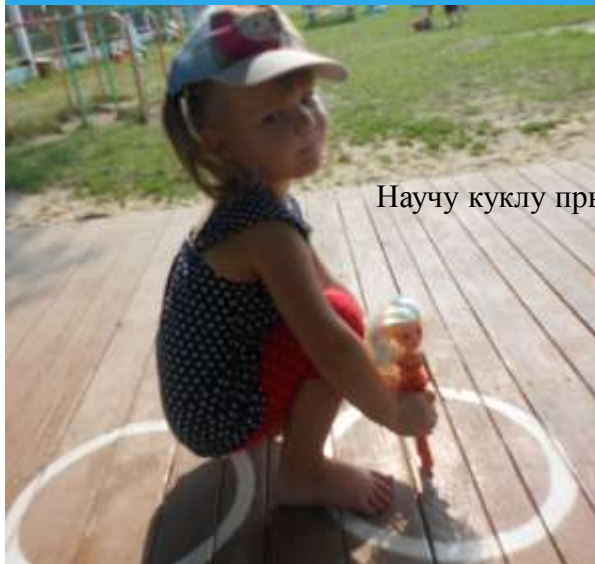
Научу куклу прыгать