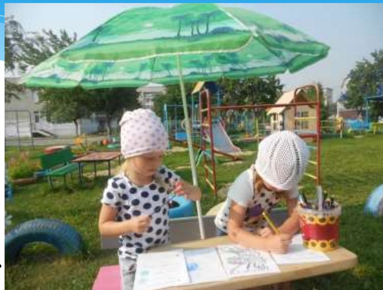
Мы любим рисовать