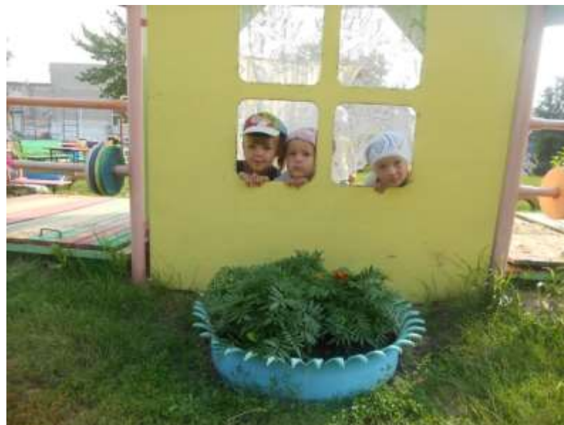
Здесь у нас красивый дом, очень нам уютно в нем