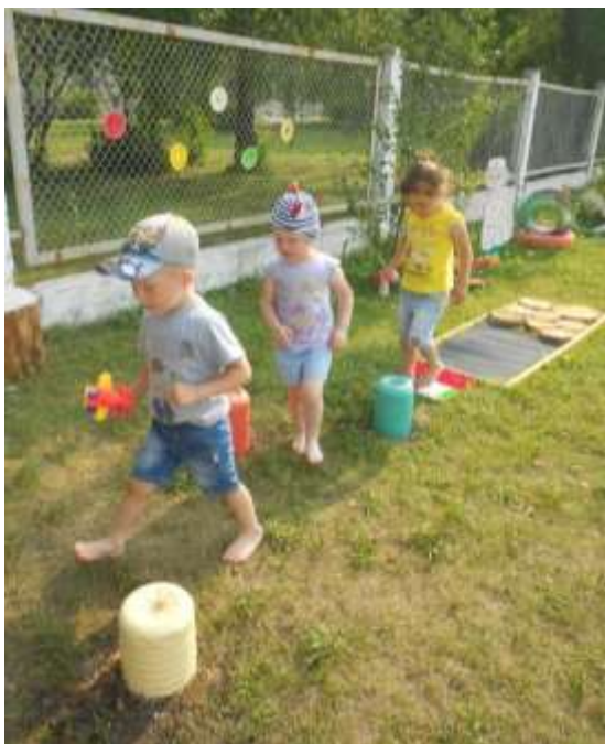
Раз пенек, два пенек Будто здесь у нас лесок. Хочешь, с ними поиграй Или просто посчитай.