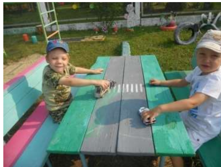
Будем учить правила дорожного движения