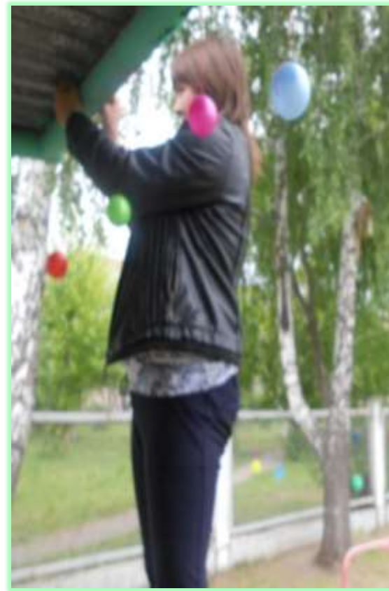
Украшение веранды шариками