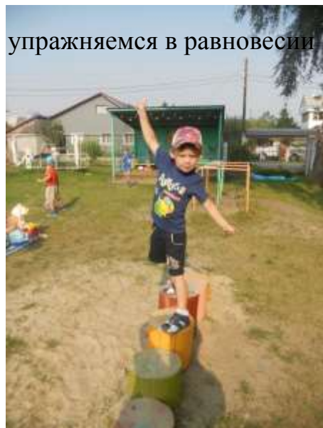
упражняемся в равновесии