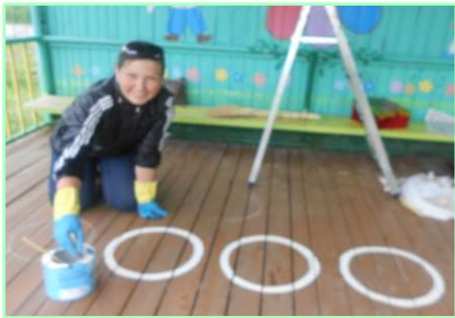
Кружки для прыжков на веранде

Родители группы с желанием приняли участие в благоустройстве участка: готовили рассаду, привозили землю, носили песок, красили постройки, изготавливали поделки из разных материалов, стараясь создать благоприятные условия для всестороннего развития наших детей..