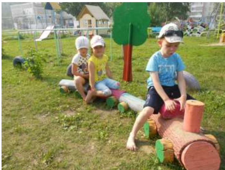
Наш веселый паровоз в детский сад детей привез