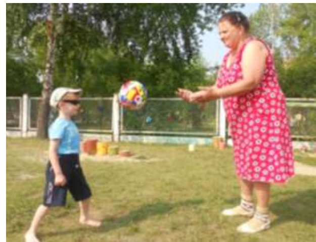
бросаем и ловим мяч