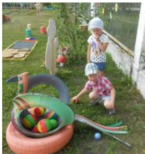
ловко забрасываем мячи