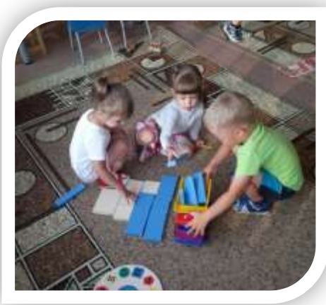
Прибирают игрушки в группе и на участке