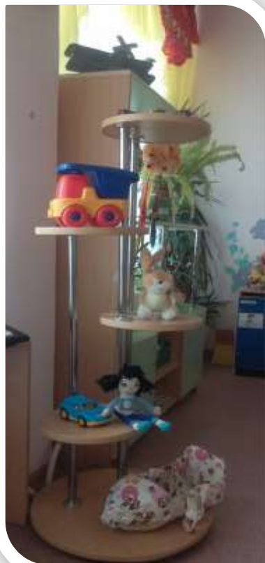
Игрушки детей из дома