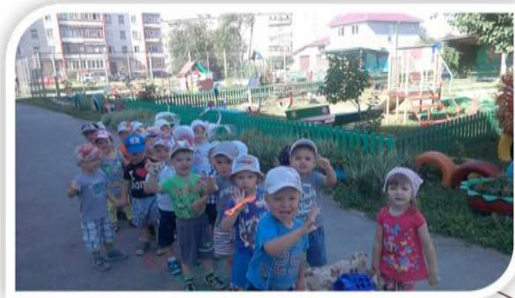
Строятся, несут игрушки на участок