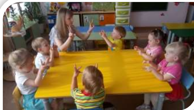
Взаимодействие с педагогом-психологом