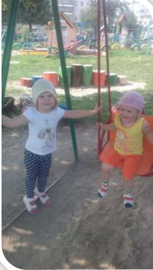
Желание помочь друг другу