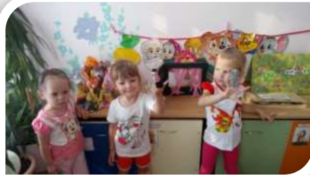
Оформление театрального уголка