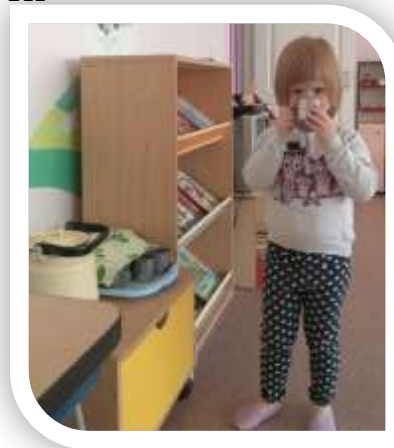
Самостоятельная организация питьевого режима