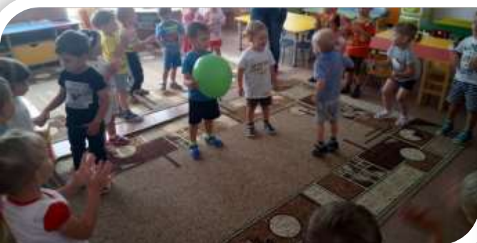
Первый день в группе