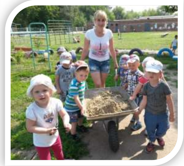
Желание помочь воспитателям