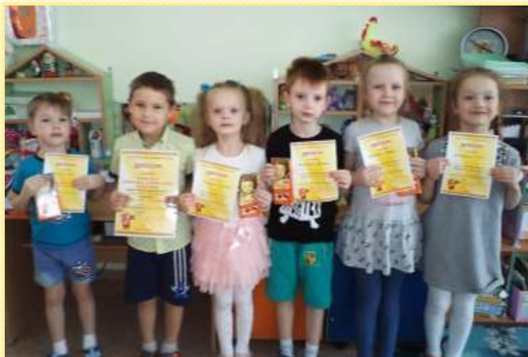
Участники муниципального конкурса «Сударыня -Масленица»