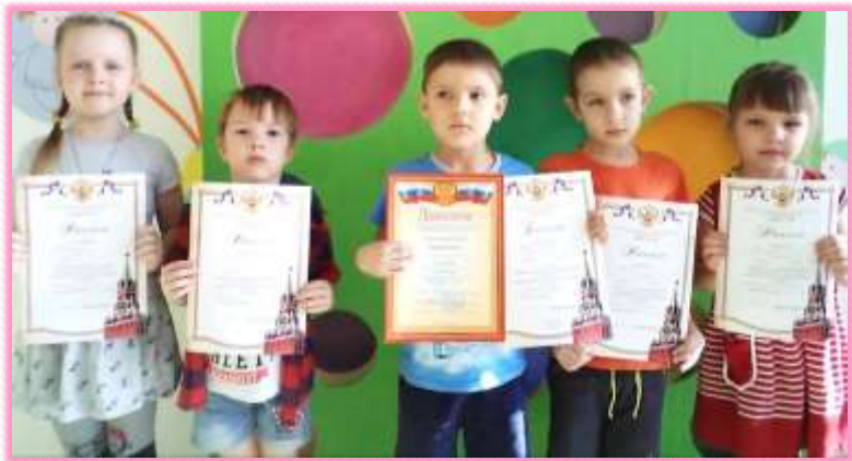
Грамоты участникам муниципального конкурса «Служу России»

Дети активно участвовали в разных конкурсах