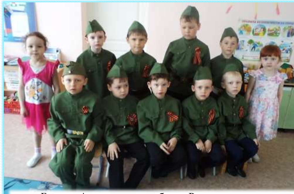
Будем в Армии служить, будем Родину хранить, Чтобы было нам всегда хорошо на свете жить!