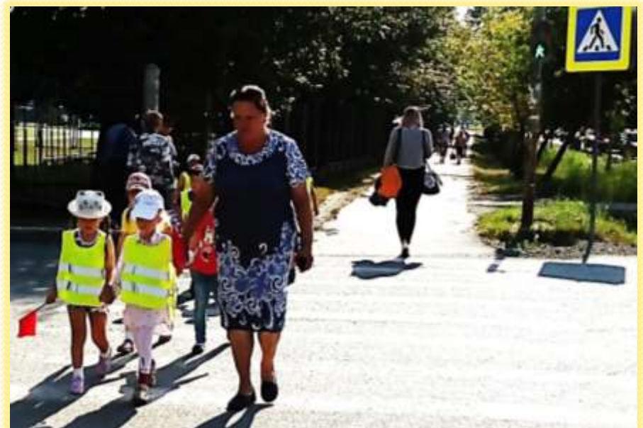
По сигналу светофора мы по улице идем. И кивают нам шоферы: «Проходите, подождем!»