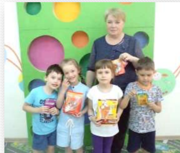
Акция «Кошки» (корм для кошек)