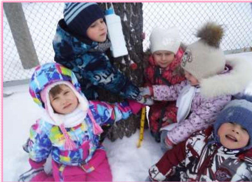
Измеряем глубину снега под березкой

Что же это за водица? Кто ответит на вопрос? О водичке все узнаем и утрем любому нос.