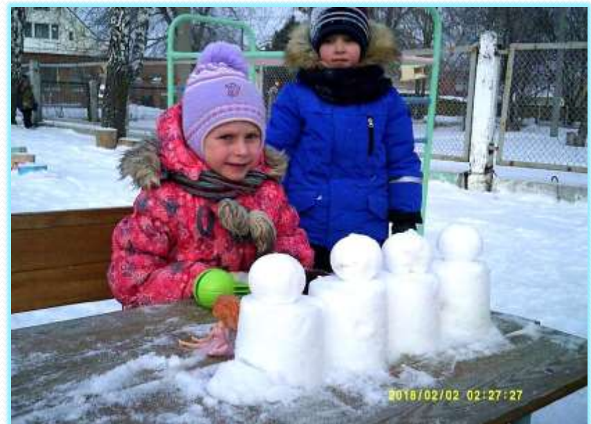
Сегодня, оказывается, снег не рассыпается