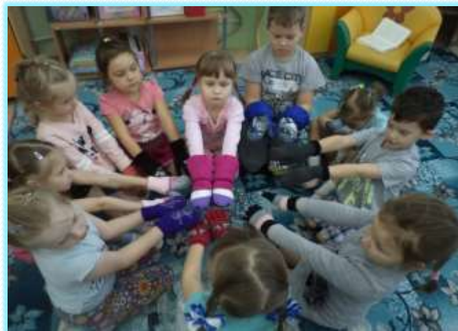
Мои варежки самые красивые и теплые (проект «Ай-да, варежка»)