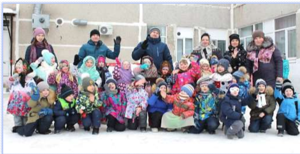
Масленица пришла, блины и радость принесла!