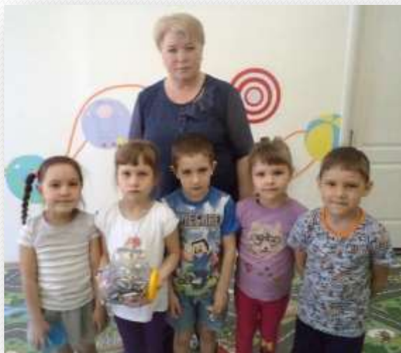
Акция «Соберем батарейки – спасем ежика»