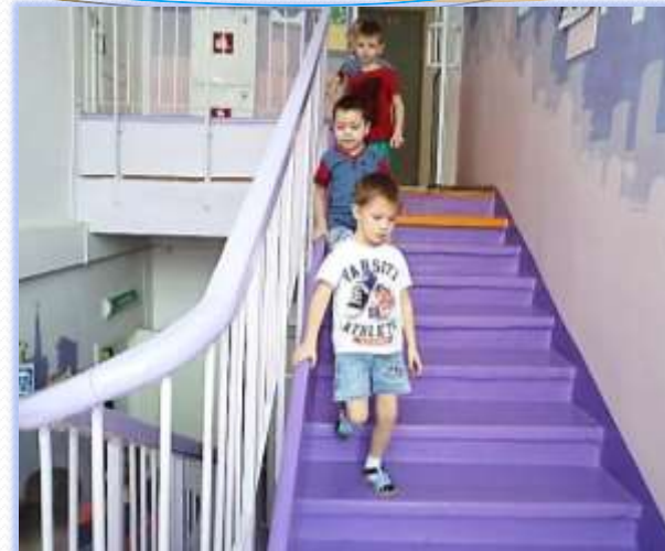
Правильно спускаемся по лестнице