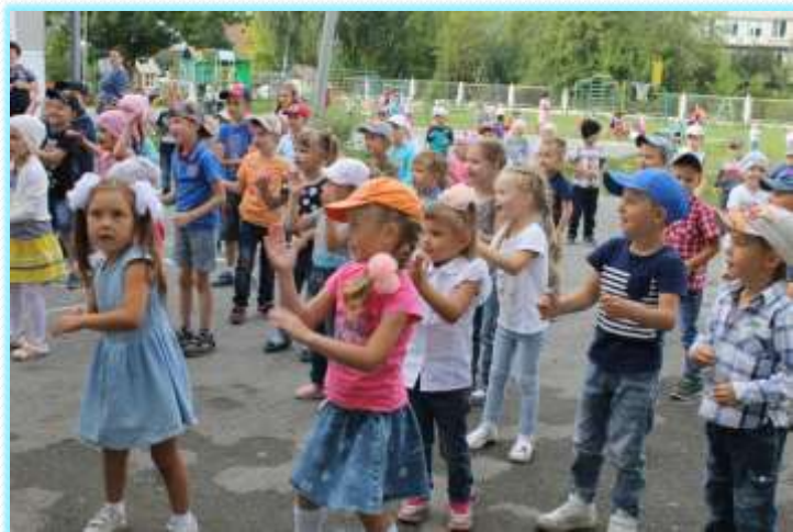
Праздничная вечеринка в день знаний

В течение учебного дети активно участвовали и в других мероприятиях