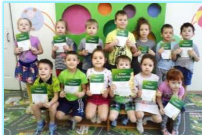
Участники международного конкурса-игры по ОБЖ «Муравей»