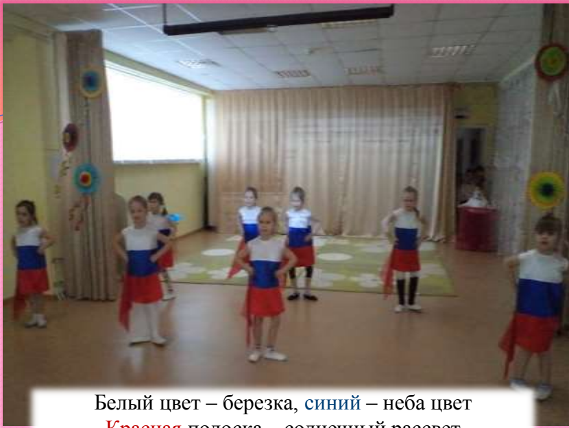
Белый цвет – березка, синий – неба цвет Красная полоска – солнечный рассвет