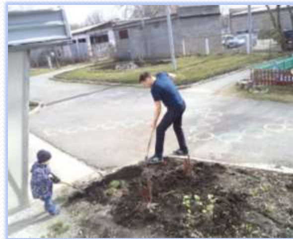
Без мужской силы не обойтись