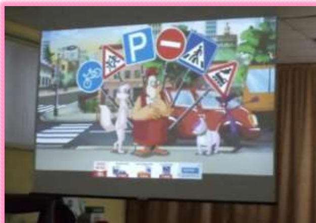
Посмотрели мультфильм «В стране дорожных знаков»