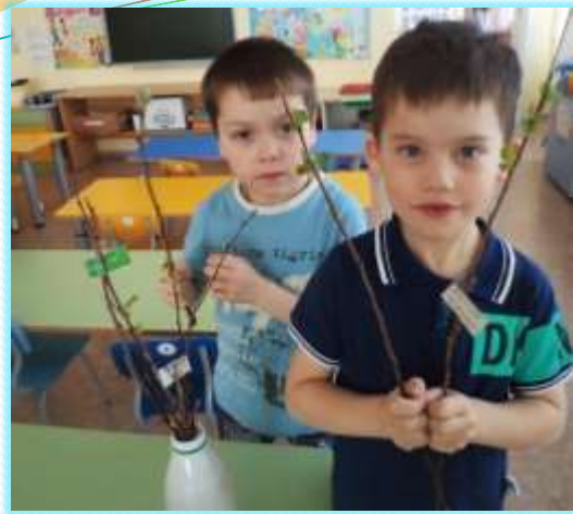
Занесем веточки в группу

Это все - эксперименты Интересные моменты! Обо всем хотим узнать! Нужно все зарисовать! Как наш опыт получился, Сколько времени он длился? Удивляемся всему: Как? Зачем? И почему?