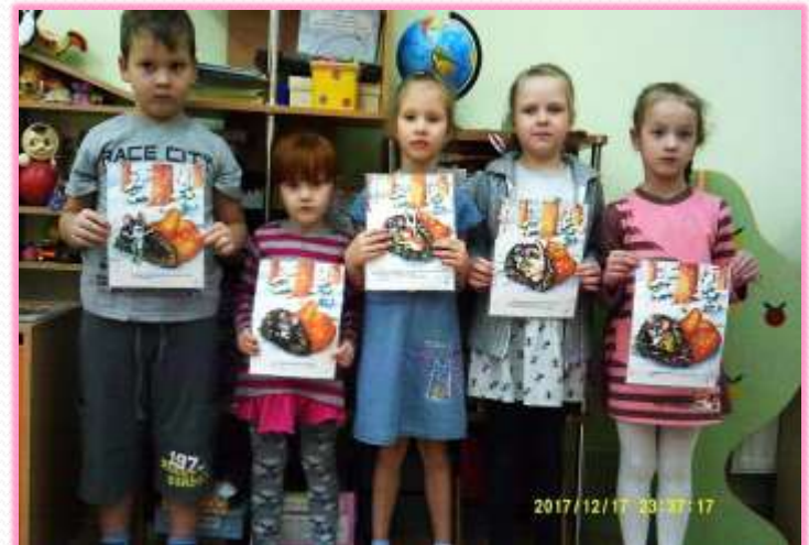
Показываем сказку «Рукавичка»