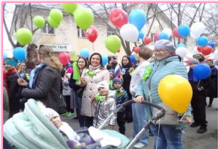
На демонстрации 1 Мая