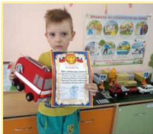
Демиду «Приз зрительских симпатий»