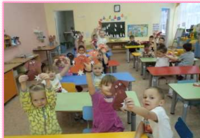
Такими необычными собачками встречали Новый год – год Собаки