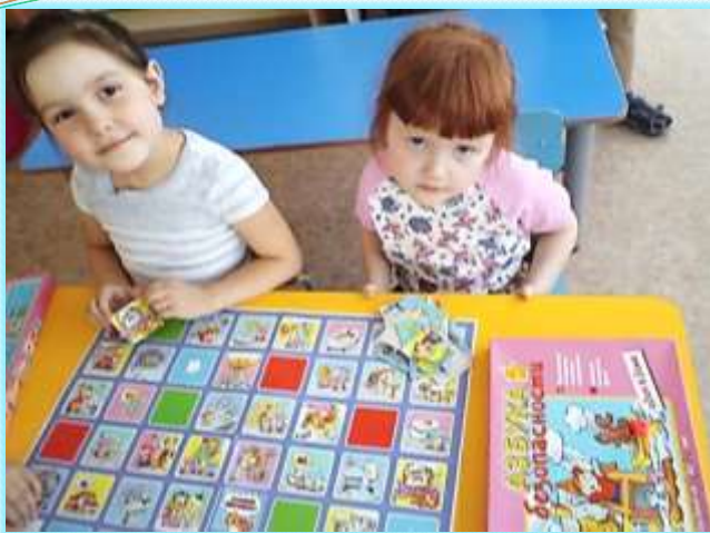
Знакомимся с азбукой безопасности