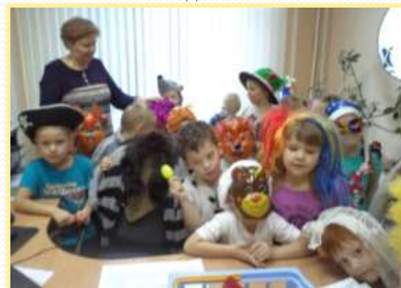
«Хозяюшка, открывай-ка сундучок, Вынимай-ка пяточок!» (рождественские колядки)