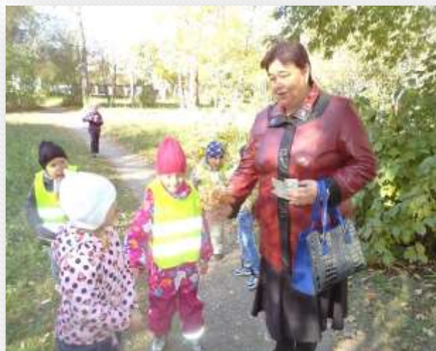
Поздравление с Днем пожилого человека